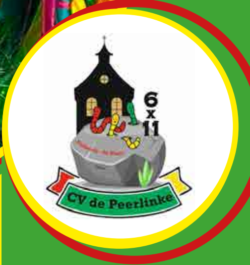
Jubileum CV de Peerlinke