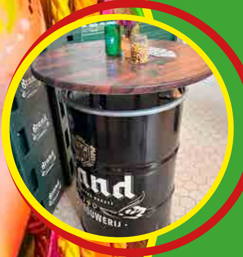
Opening nieuw Brand Bier Brouwhuis