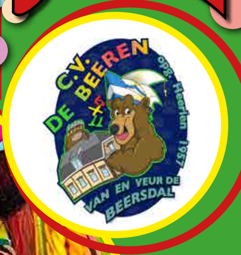
CV de Beeren